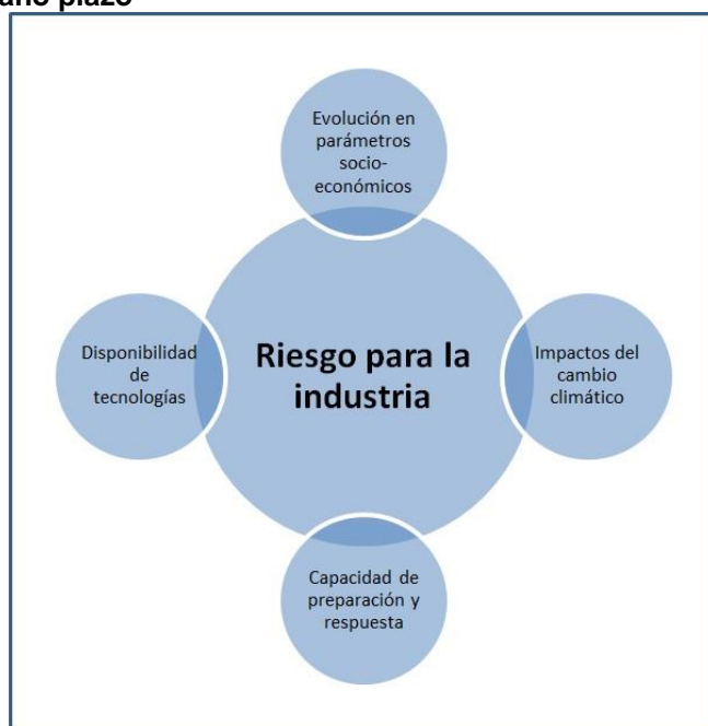
Figura 1: Determinantes del riesgo asociado con el cambio climático en el corto y mediano plazo

Del mismo modo, no ha sido posible obtener un panorama de las capacidades en términos de preparación y respuesta a los eventos climáticos. En consecuencia, suponemos que esas capacidades son limitadas, en comparación con las 'buenas prácticas' en otros países. 2 La implicación que de esto se deriva con respecto al análisis es la siguiente: se ha asumido que la